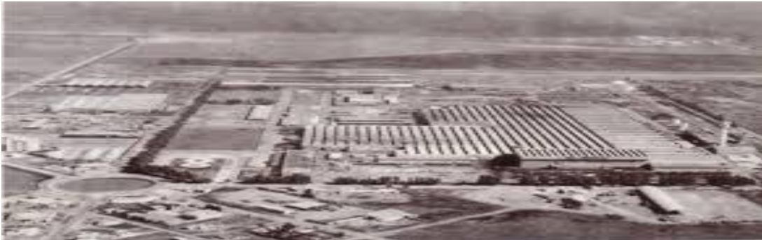
Planta de Industrias Mecánicas del Estado (IME)

Sobre la base de acuerdos y aportes de capital, entre la estadounidense Kaiser, el gobierno nacional a través del IAME, y un crédito del Banco Industrial, queda constituida Industrias Kaiser Argentina, que en un desarrollo posterior daría nacimiento a varias subsidiarias como TRANSAX, PERDRIEL, ILASA.