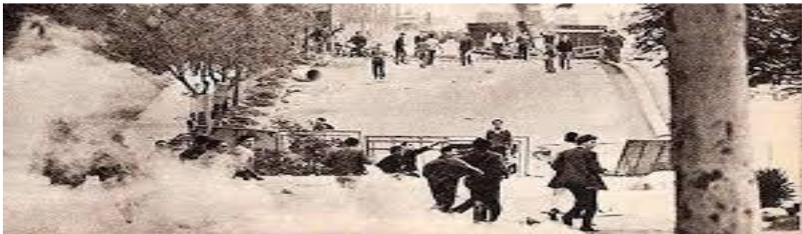
Cordoba ciudad tomada

Quien escribe estas líneas fue testigo presencial de reuniones universitarias, y en colegios mayores (pensionados de estudiantes), donde se exhortaba no adherir al paro llamado por la “burocracia sindical”, me consta además porque conocí política y personalmente a muchos de estos dirigentes en su militancia universitaria o gremial. Ese sectarismo demostrado el 29 de mayo lo trasladaron luego al plano gremial en el que a algunos les tocó actuar como dirigentes de los llamados gremios “clasistas”, o “combativos”