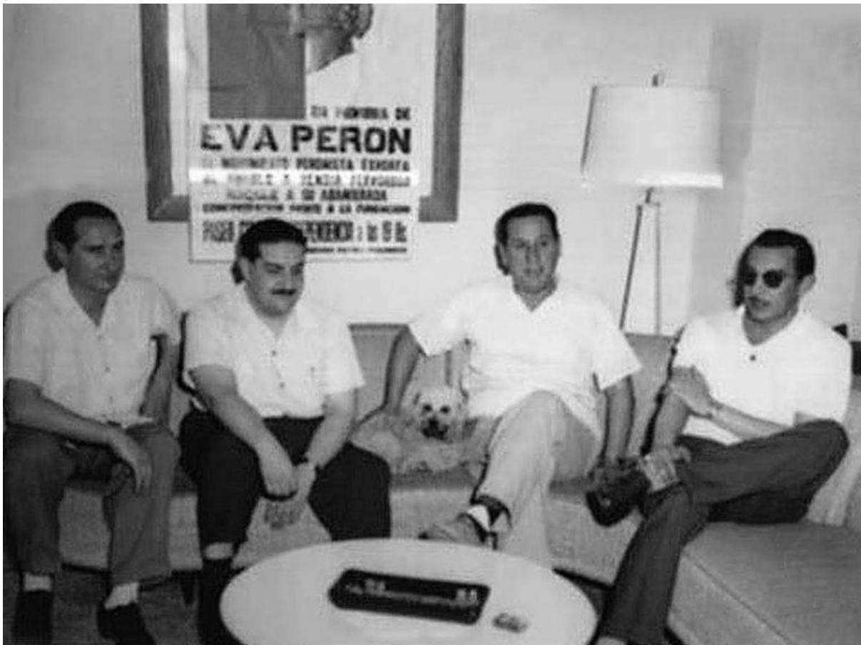
Peron com Framini, Cooke y Vandor

Poco fue el tiempo para capitalizar el triunfo del Cordobazo. A horas de reunirse con Onganía con el espaldarazo que le otorgó la movilización cordobesa, Augusto Timoteo el “lobo”, Vandor es asesinado en su propio sindicato por un grupo comando, iniciando un ciclo siniestro de atentados contra dirigentes sindicales peronistas