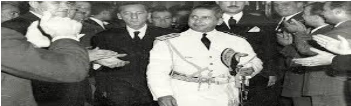
Brigadier Juan Ignacio San Martín

Córdoba se había constituido fundamentalmente a partir de 1945 en uno de los centros industriales más importantes del país. El impulso que el peronismo le imprimió a la Fábrica de Aviones fue decisivo. Bajo la batuta del Brigadier San Martín, elegido gobernador en 1948, se crea en 1952 un gran complejo industrial: IAME, Industrias Aeronáuticas y Mecánicas del Estado, como empresa autárquica sometida al régimen de Ley N. 13.653 de empresas del estado con las funciones de investigación, fabricación de material aeronáutico, y la promoción y producción automotriz; esto último debido a la negativa de varias terminales automotrices que sostenían que la Argentina sólo podía ensamblar y no producir integralmente automotores.