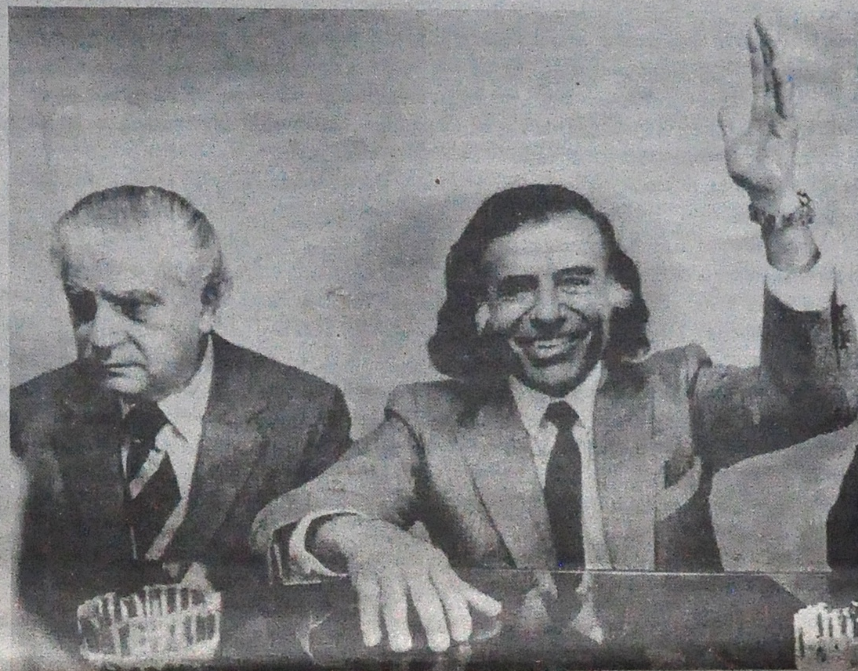
El senador Antonio Cafiero ha señalado reiteradamente que él acompañó al presidente Menem con el mejor ánimo, tanto desde su embajada en Chile como desde la Cámara Alta.

Todos los enemigos de Menem, internos y externos, son mirados con benevolencia por la degradada prensa del Puerto. Es cierto que muchos de tales