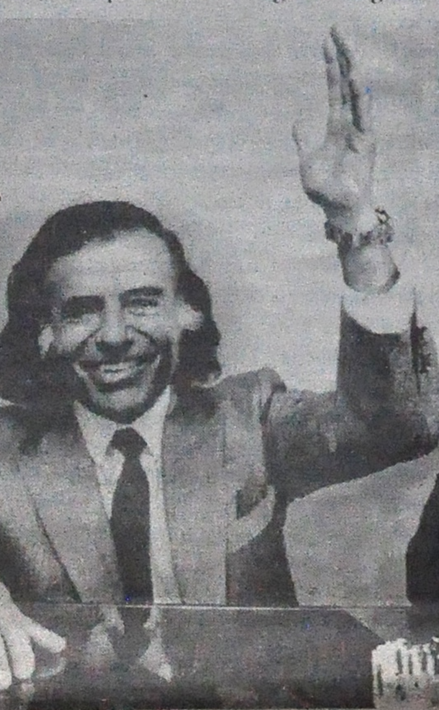
El senador Antonio Cafiero ha señalado reiteradamente que él acompañó al presidente Menem con el mejor ánimo, tanto desde su embajada en Chile como desde la Cámara Alta.