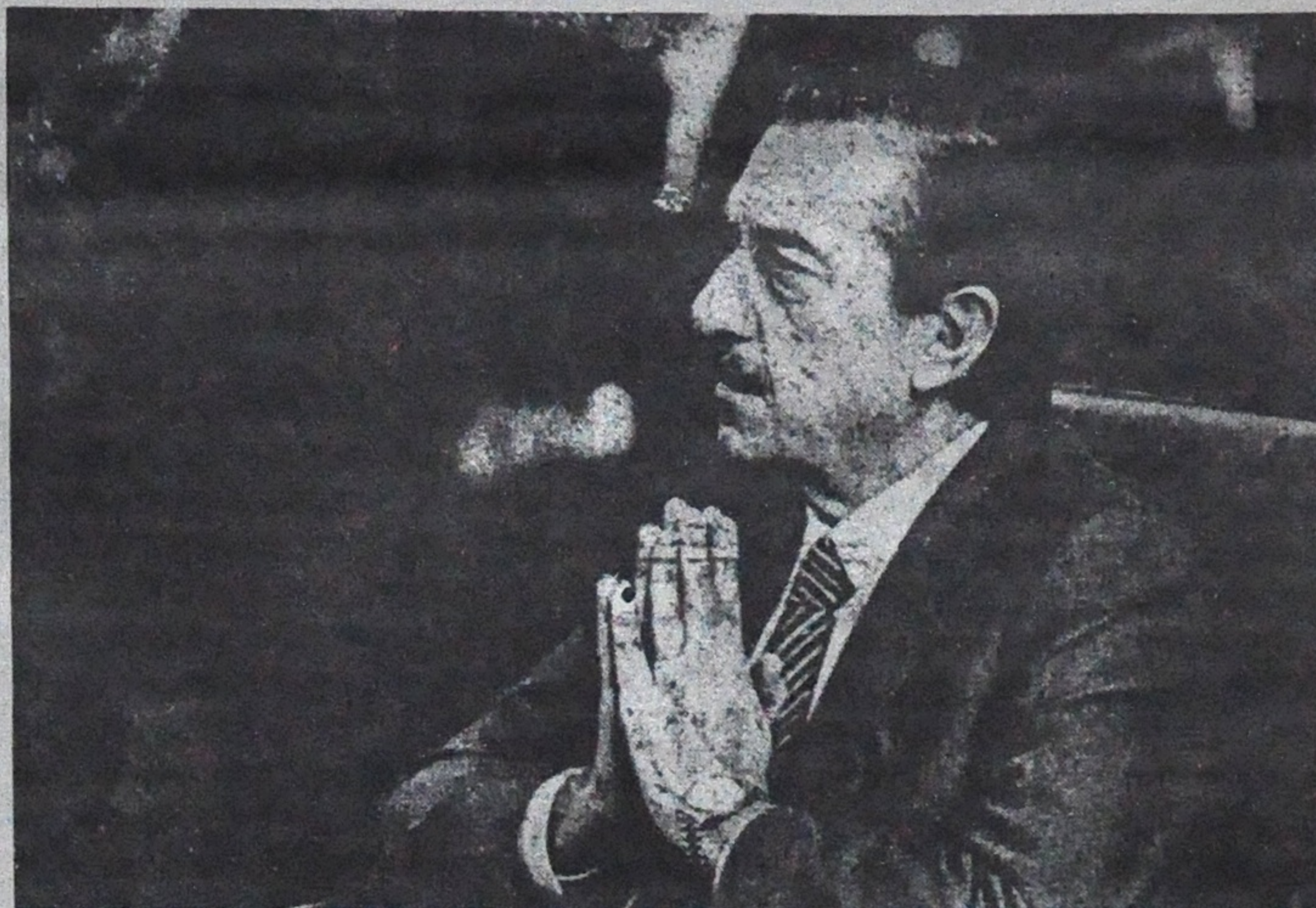
Ningún recurso será desechado por la UCR para que la Reforma no salga

Lo que sucede en realidad es que "consenso" en boca de estos senadores significa "necesidad de conciliar posiciones con...Raúl Alfonsín". Son los restos del renovadorismo antimememista. Suena casi ridículo oír a Alfonsín, a Bordón y a Cafiero diciendo que ellos no tiene nada que ver en sus objetivos, sólo que están en la línea del "abrazo de Perón y Balbín". Cafiero puede